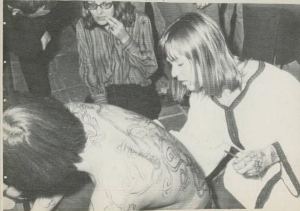
(AP) Utrecht, Netherlands, Nov 25 (AP)- Accompanied by the sounds of 50 orchestras around 10,000 teenagers started last night a hippy festival which ended this morning here. In picture one of the girls painting the back of the hip and flower lovers. (AP WIREPHOTO) (1/251167str/sticht/www)