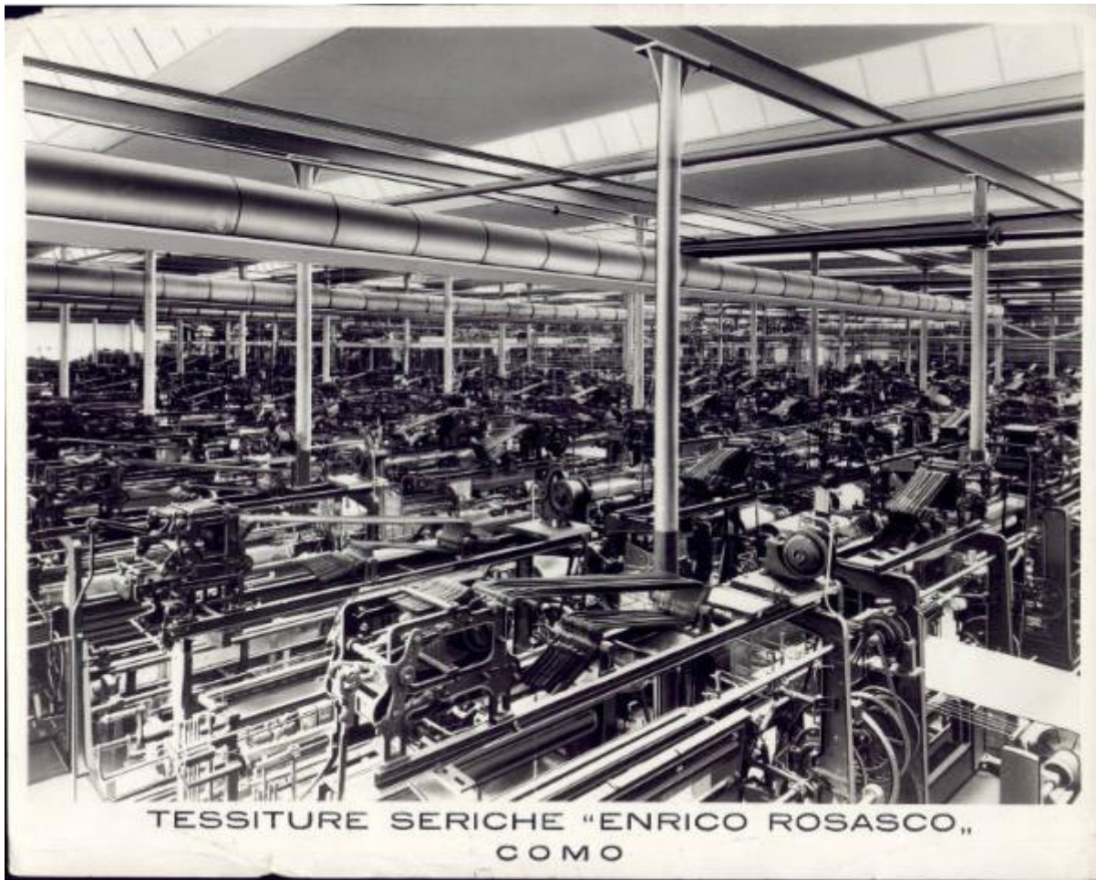
TESSITURE SERICHE "ENRICO ROSASCO," COMO