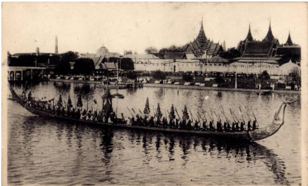
Royal Barge and Palaco—Bangkok