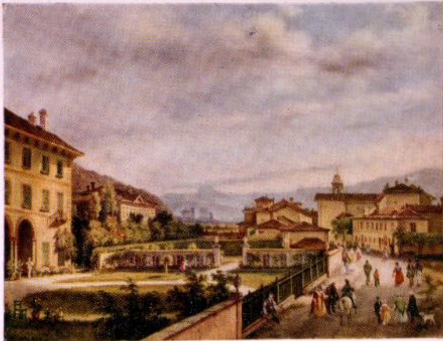
Della tela ad olio del pittore Renica - 1840

e - War s - Ne a - Co and Mu iconi Fo oragni's igation - e Valleys nos (Too