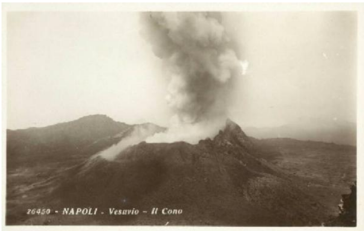
26450 - NAPOLI - Vesuvio - Il Cono