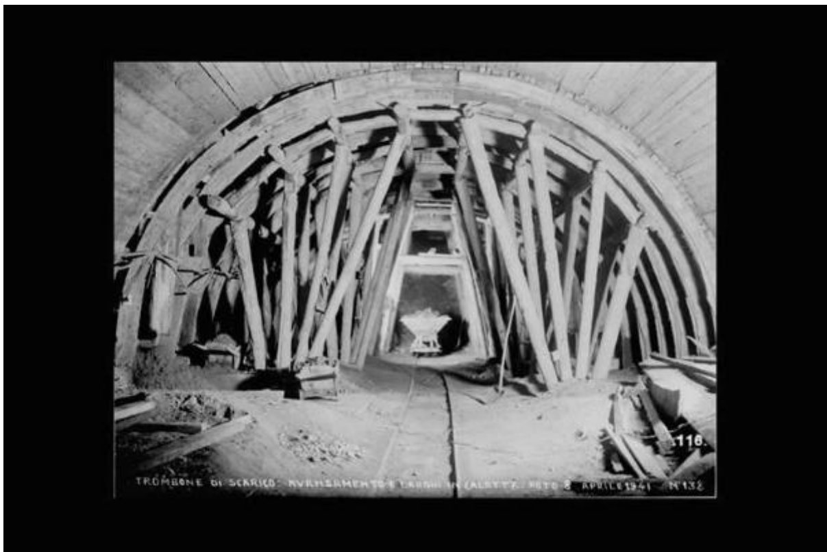
TRONCONE DI SCARICO: RIVESTIMENTO E TAVOLI IN ALBETTO. FOTO 2 APRILE 1941 - N° 132