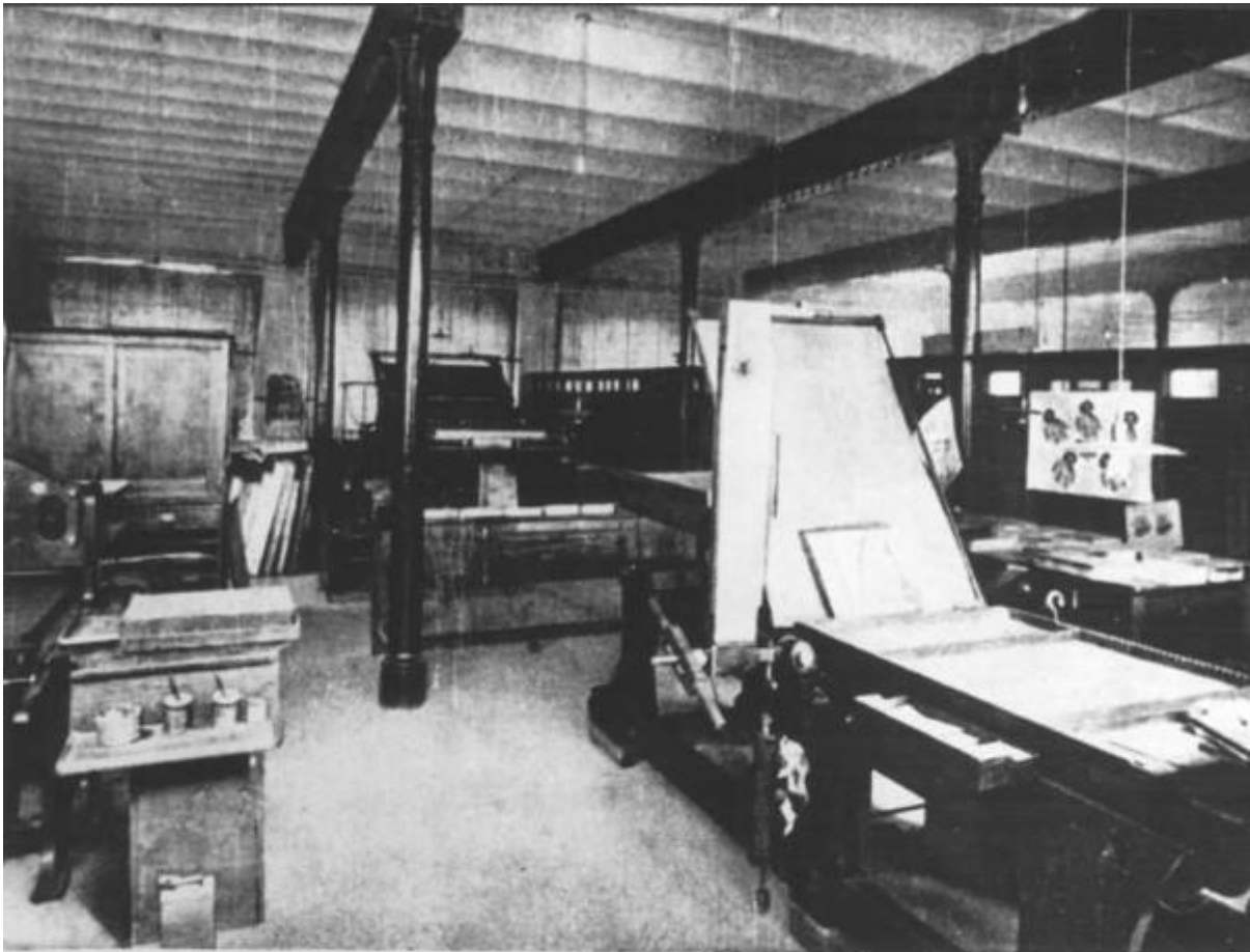
Sezione: STAMPA LITOGRAFICA (Torcolieri e Macchinisti)