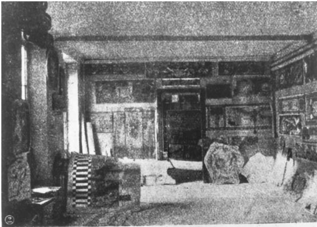
Cooperativa Pittori e Imbiancatori — Laboratorio.

Link risorsa: https://www.lombardiabeniculturali.it/fotografie/schede/IMM-LOM60-0005425/