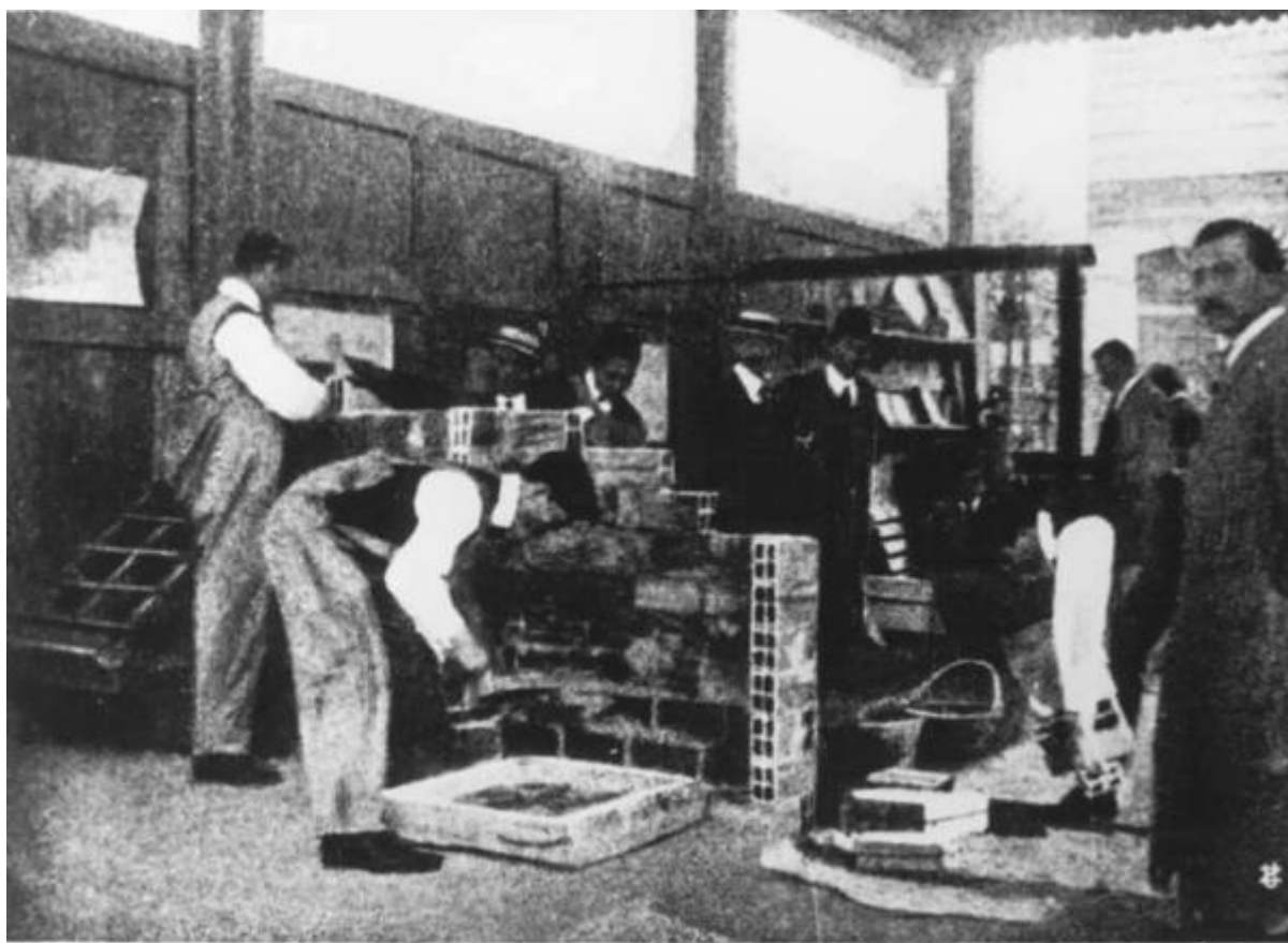
Campo di esercitazioni pratiche