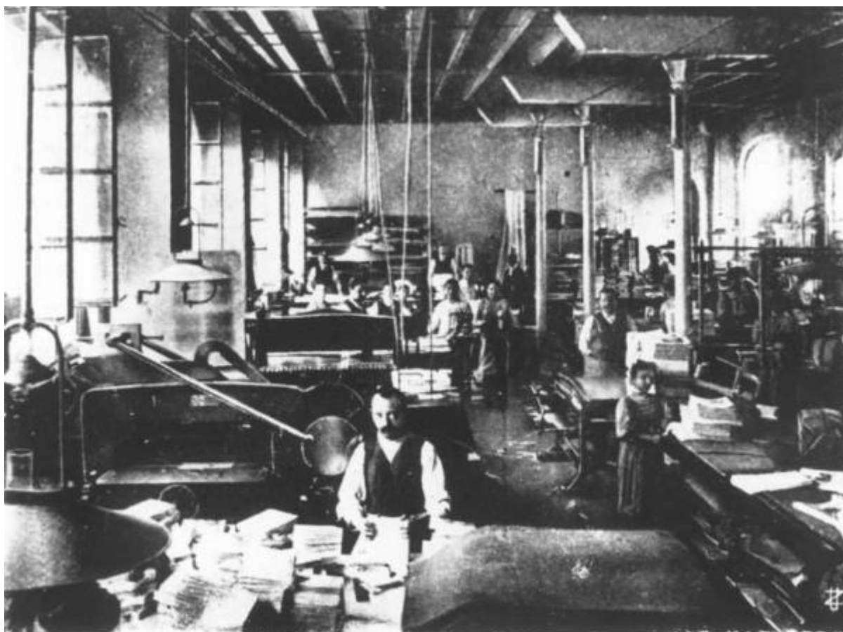
Casa del Popolo - Cooperazione. — Un laboratorio della Cooperativa Legatori.

Link risorsa: https://www.lombardiabeniculturali.it/fotografie/schede/IMM-LOM60-0005428/