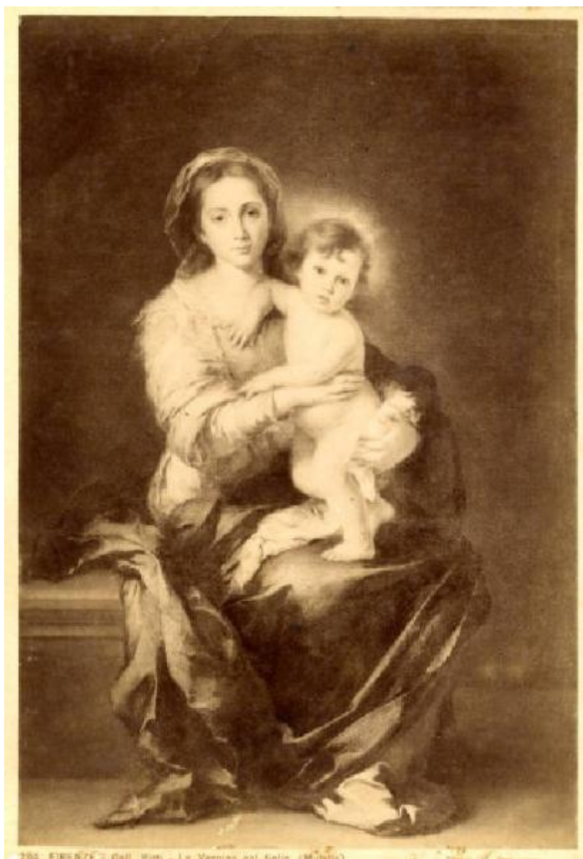
284. FIRENZE - Gall. Pitt. - La Vergine col figlio (Milk)