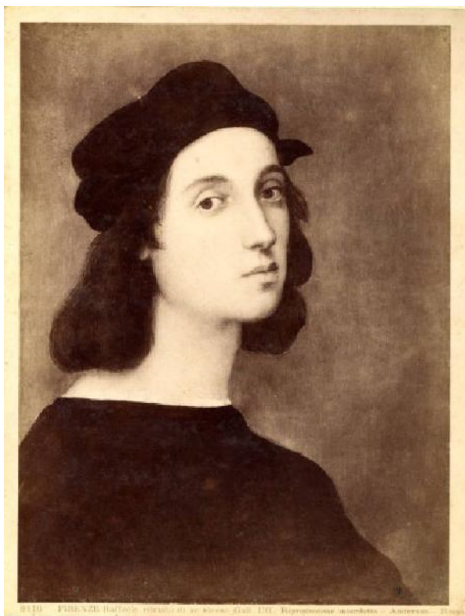
8110 FRAZIO Battista ritratto di un'aristocrazia - Anonimo - 1500