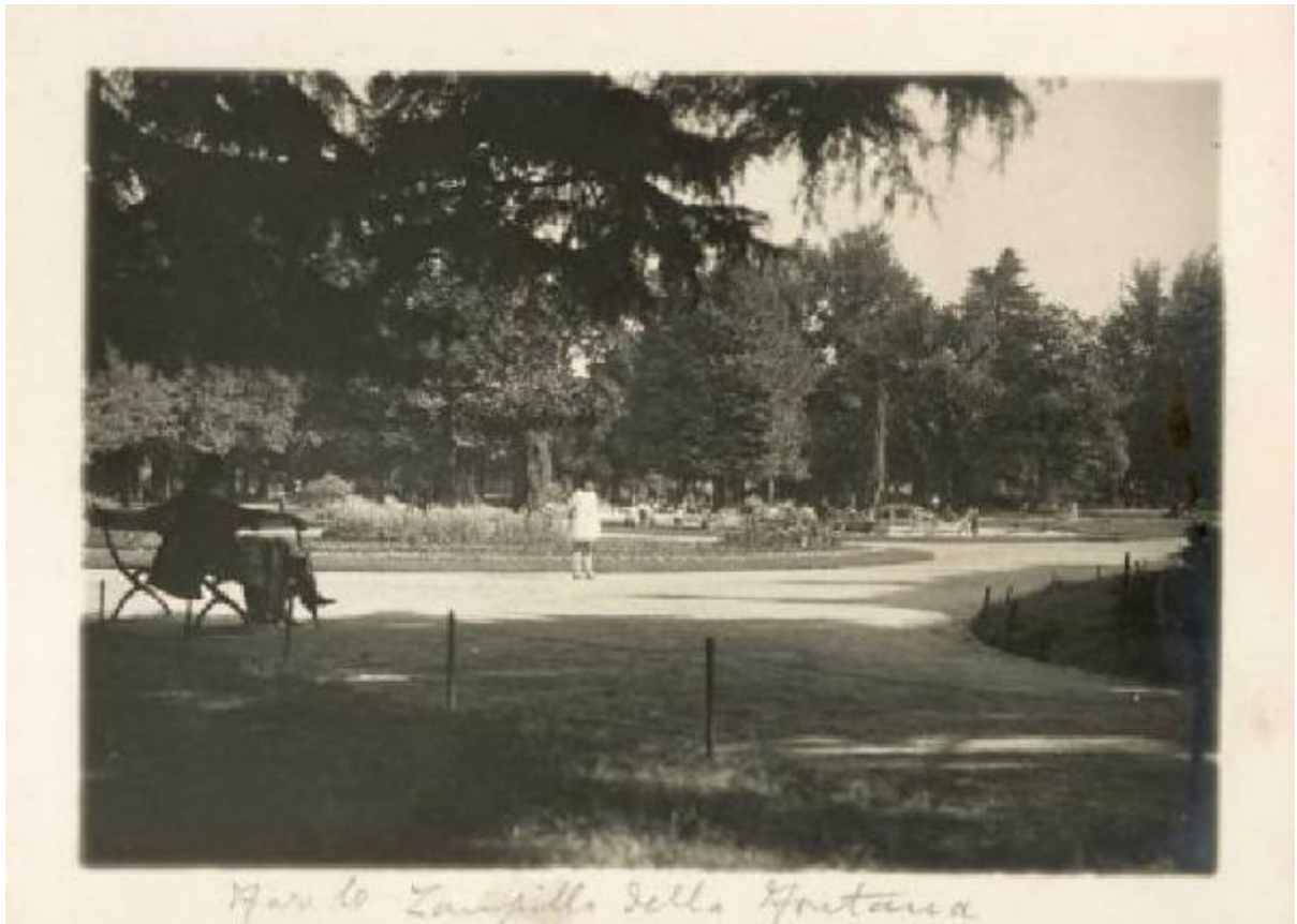
Mare lo Zampillo della Spiritosa