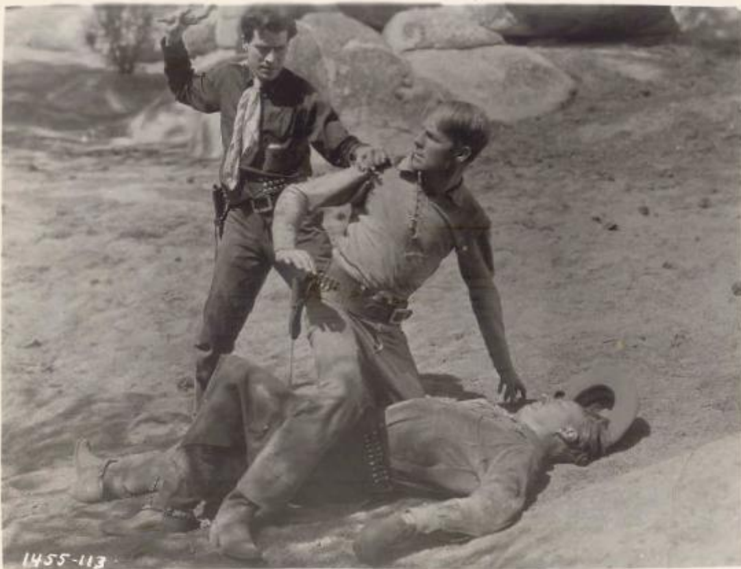
RANDOLPH SCOTT in Zane Grey's "TO THE LAST MAN" with Barton MacLane, Gail Patrick and Fuzzy Knight A Favorite Films Release