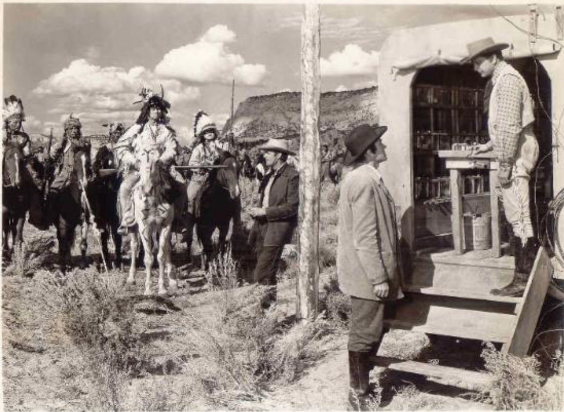
Zane Grey's "WESTERN UNION" with ROBERT YOUNG, RANDOLPH SCOTT, DEAN JAGGER, A Foxcatcher's Camera VIRGINIA GILMORE and John Carrolline, Slim Summerville, Chill Wills, Benon MacLane. Fox Pictures MAY 1928