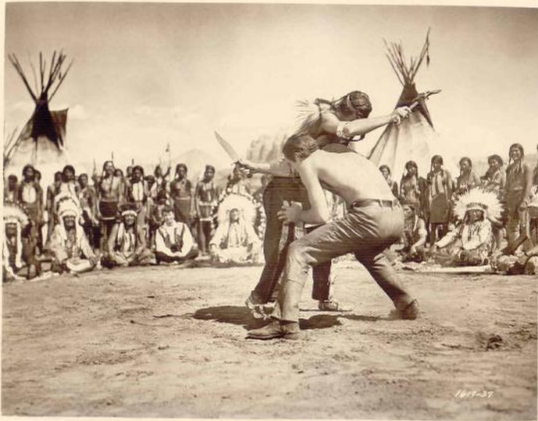
"COMANCHE TERRITORY" - A Universal-International Picture. Copyright 1950 Universal Pictures Company, Inc. Permission granted for newspaper and magazine reproduction. Any other use, including revision, prohibited. Printed in U.S.A.