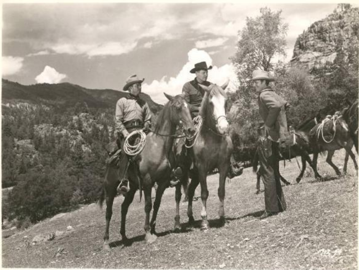
"Copyright 1953 Universal Pictures Company, Inc. Permission granted for newspaper and Magazine reproduction. Any other use, including television, Prohibited." Printed in U.S.A.