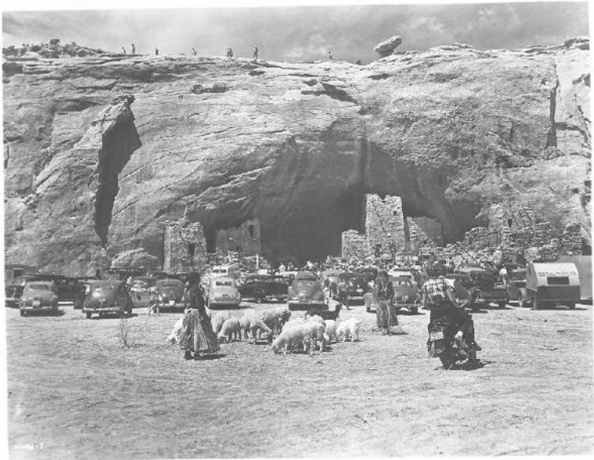
Copyright © 1935 by Paramount Pictures Corporation. All rights reserved. No republication or other use without the written consent of Paramount Pictures Corporation. (461) (10.5.9)