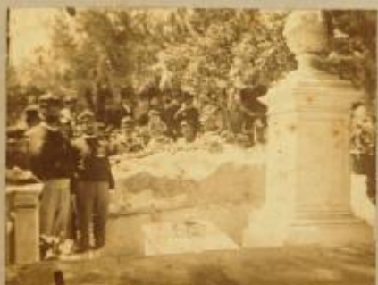
Desso che è tomba di Garibaldi, e i suoi monumenti, alle figlie Rosa e Annita.