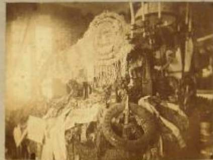
Camera e letto ove morì Garibaldi, a cura di Coscia.