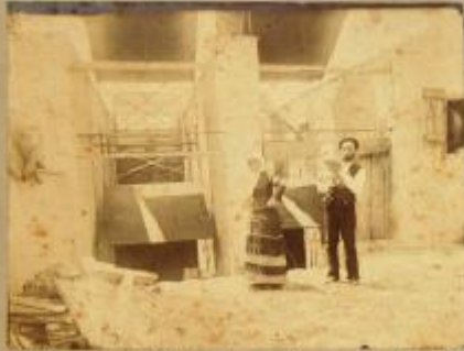
Nobilio Garibaldi, macinava il grano per la famiglia.

Ricordo del 1° Pellegrinaggio alla Tomba del S. Garibaldi, in Caprea, il 4 giugno 1894.