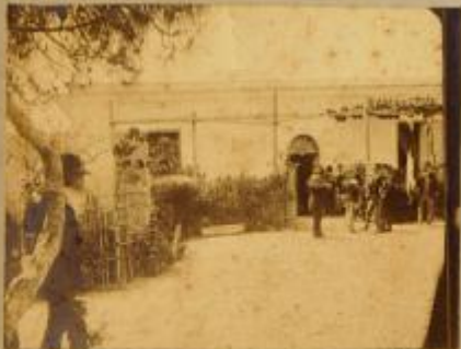
Veduta del Cortile della casa di Garibaldi.