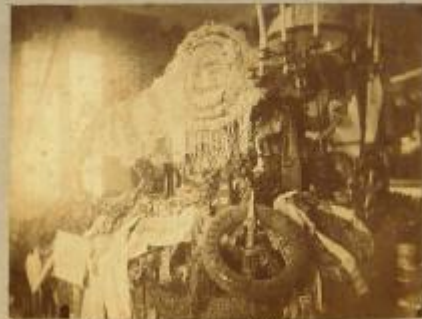
Camerata e letto ove morì Garibaldi, adorato di cosori.