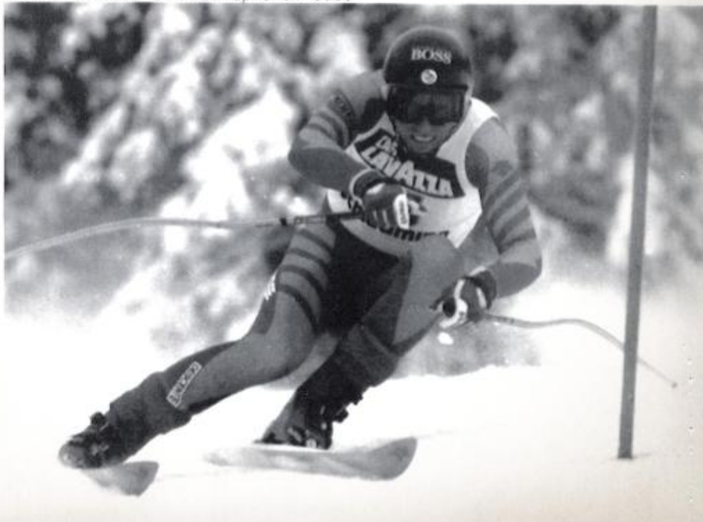
SCHL-1)SCHLAGNING,AUSTRIA,NOV.26(AP)---WINS FIRST WORLD CUP RACE---Switzerland's super skier Pirmin Zurbriggen speeds past a course flag on the Planai course on his way to win the men's Super-G, the first World Cup race of this season. It was Zurbriggen's 32nd victory in a World Cup race. AP-WIREPHOTO)-c-(mwl1320str/Pentapfoto) 1988