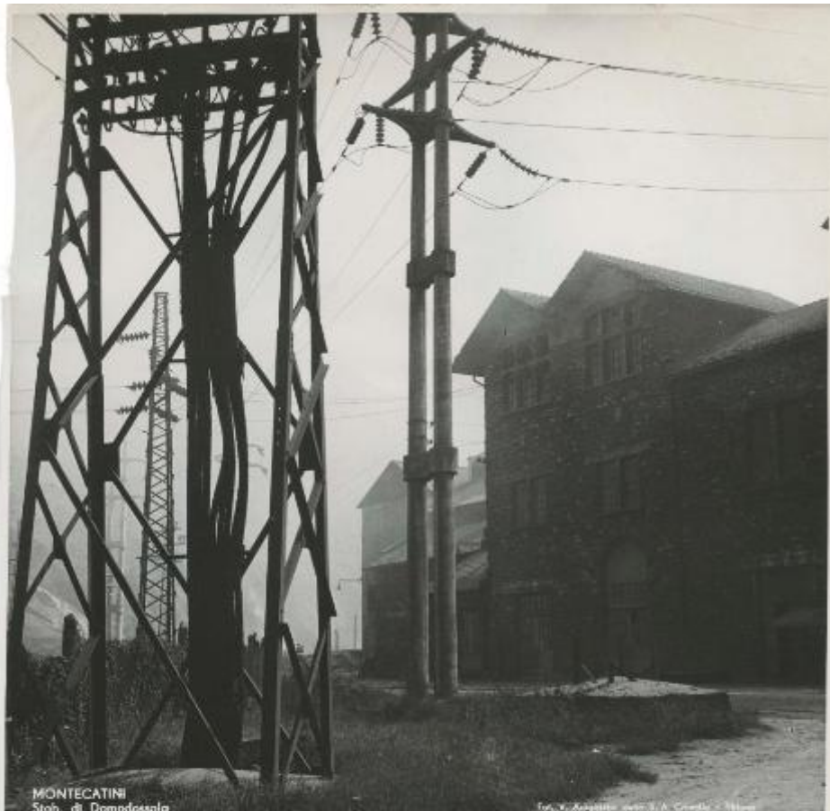
MONTECATINI Stab. di Domodossola