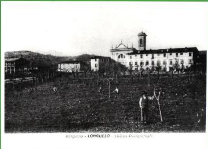
Bergamo - LONGUELO - Chiesa Parrocchiale