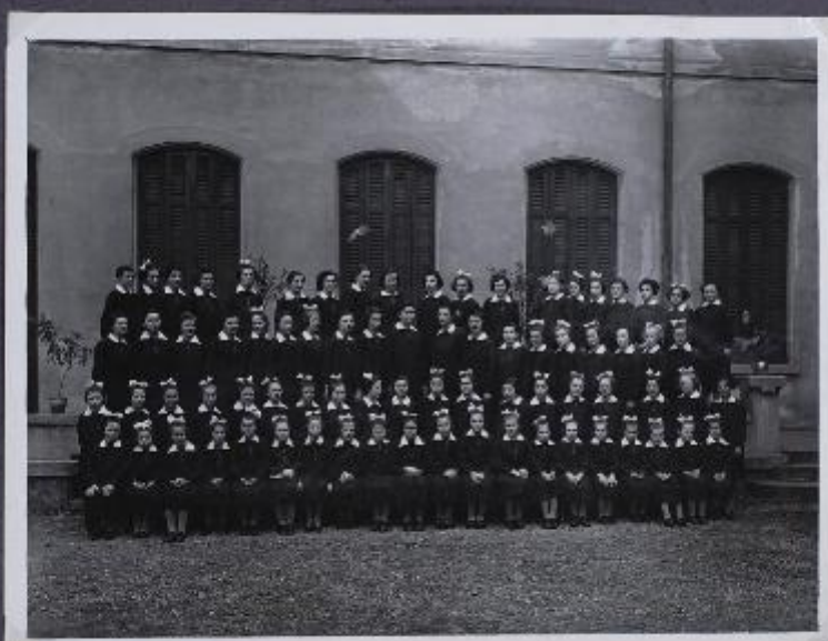
...anno scolastico... 1953-1954 ?