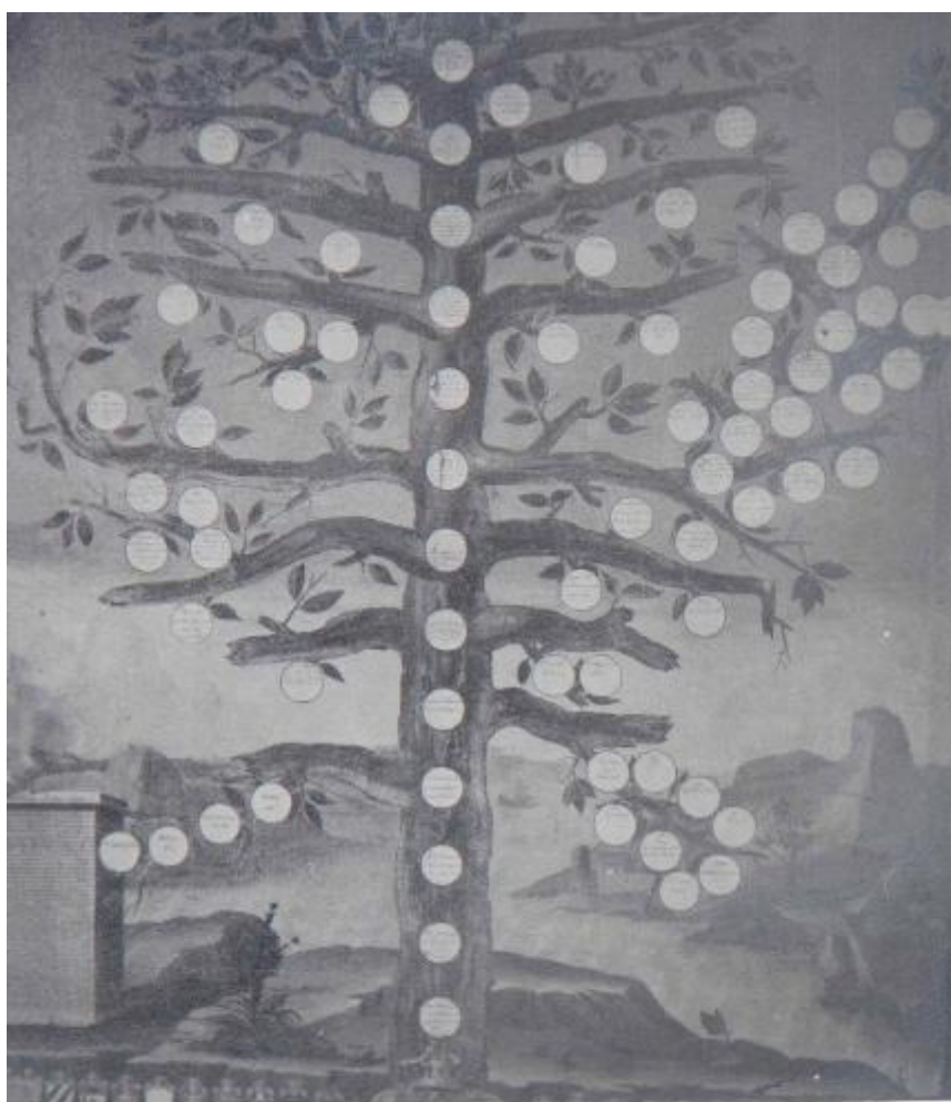
Albero genealogico "Giovinio"