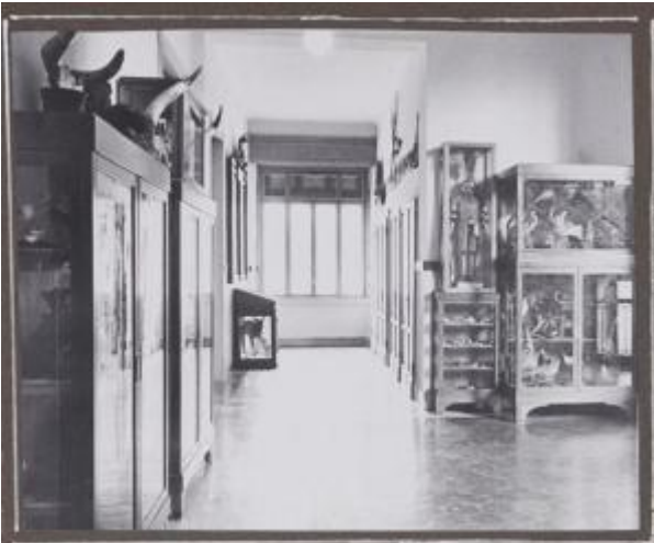
il Museo, "sotto gli occhi" degli allievi.