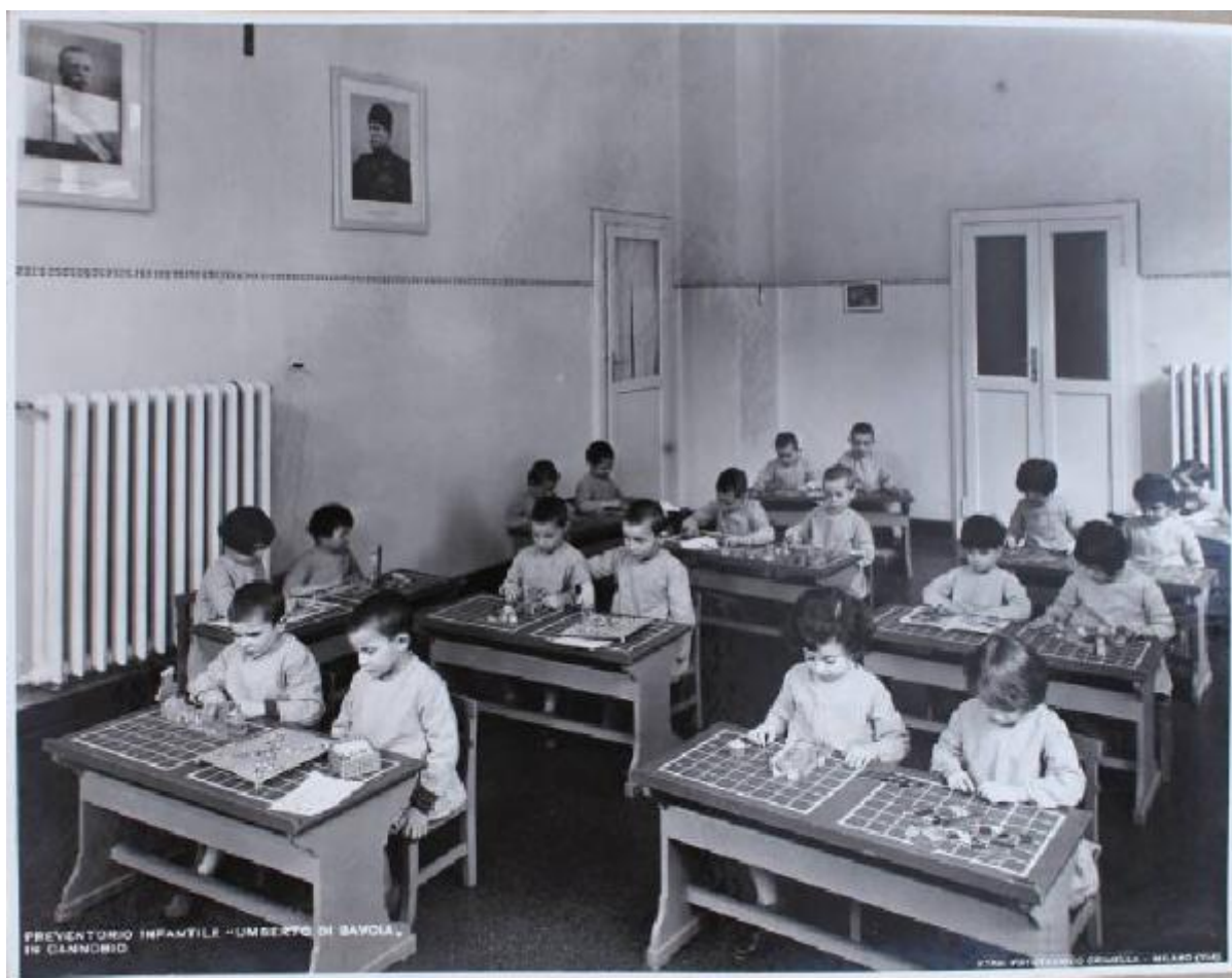
PREVENTORIO INFANILE - UMBERTO DI SAVOIA - IN CLANONICO