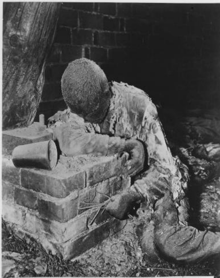
EA 63152 - Bruciato vivo! L'indolce è spirato mentre invocò ai diabolici per sfuggire ad una orribile tortura. Insieme a lui 150 prigionieri furono bruciati con paglia imbevuta di benzina nei pressi di GARDELEGEN.