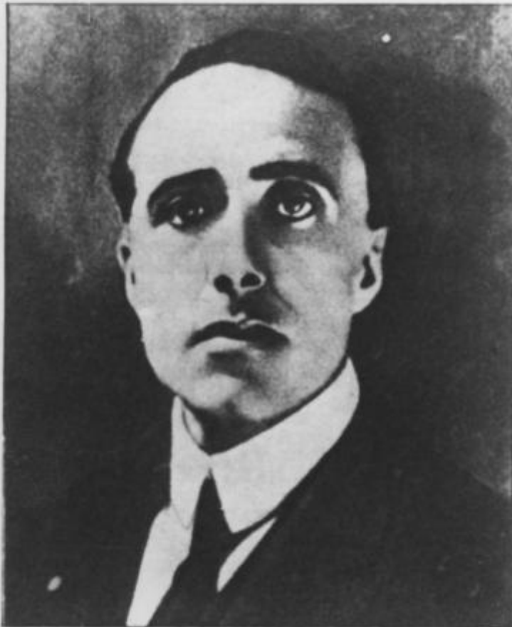
Giacomo Matteotti, la cui tragica fine, nel giugno del 1924, è legata alla sua denuncia dei metodi elettorali e alla documentata critica della politica economica del fascismo