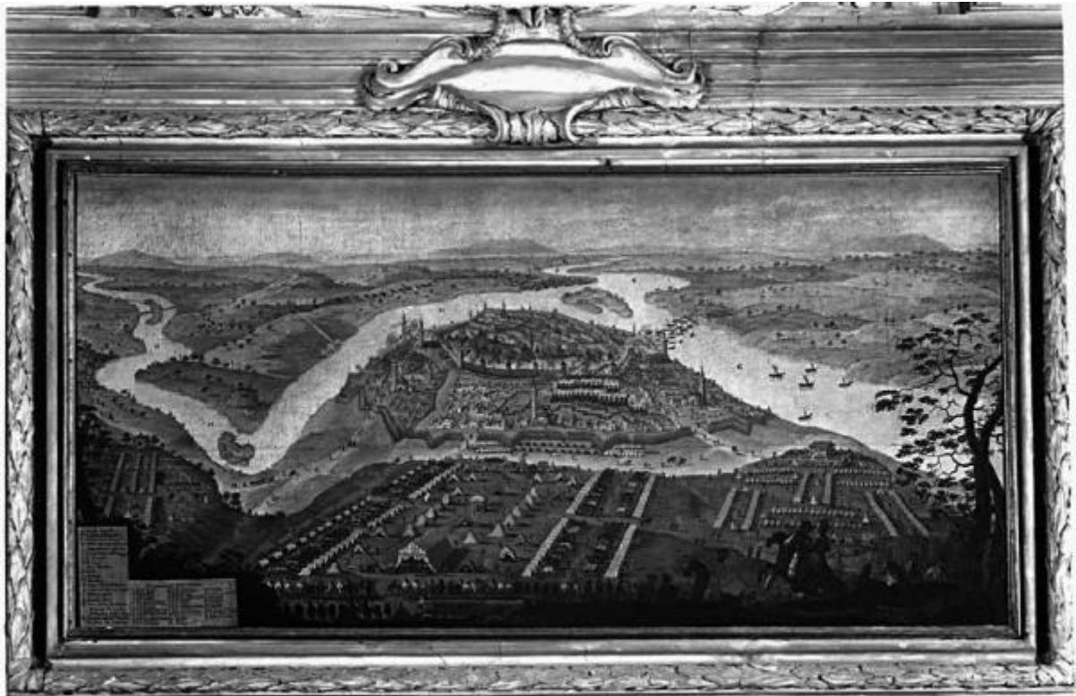
„L'assedio di Belgrado” - Gefles Mantova - Palazzo Sordi

Link risorsa: https://www.lombardiabeniculturali.it/fotografie/schede/IMM-r5020-000077/