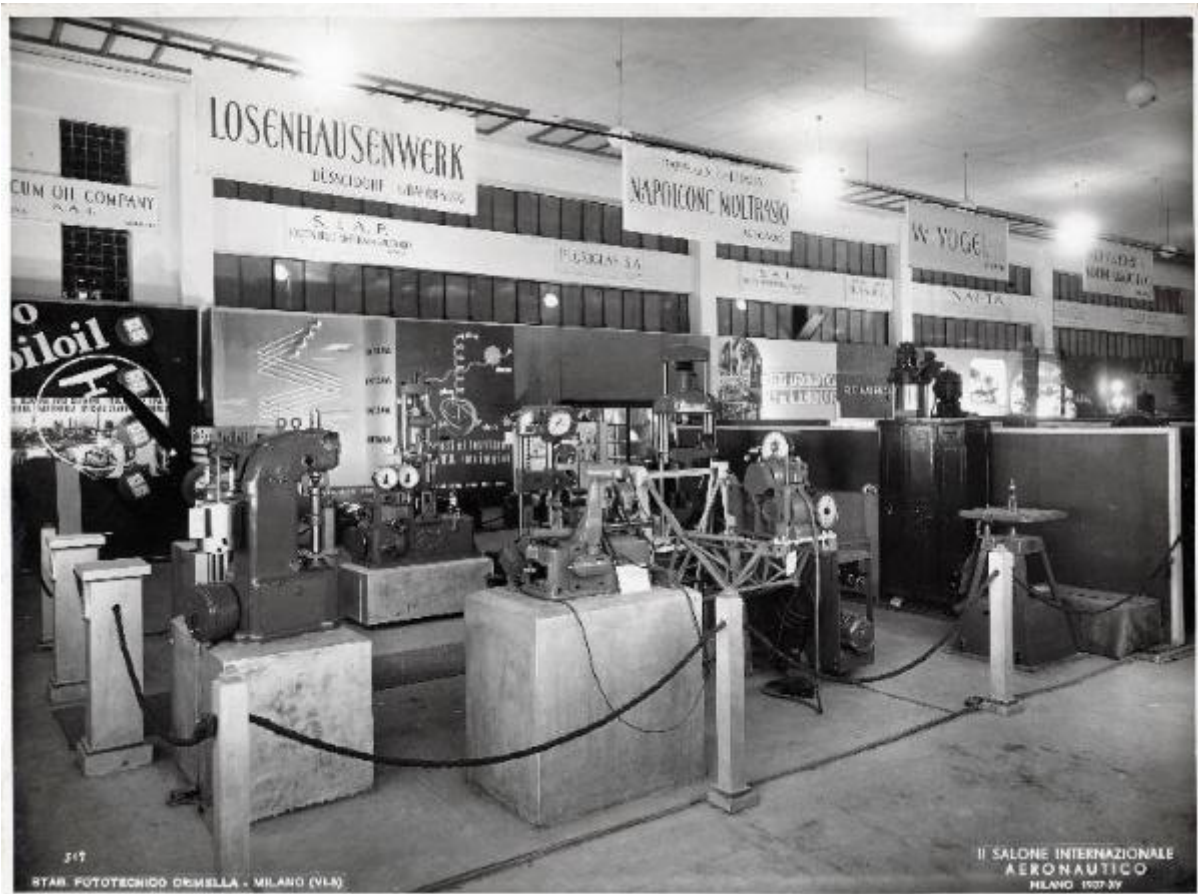
STAR FOTOTECHICO OMBRELLA - MILANO (VLA)