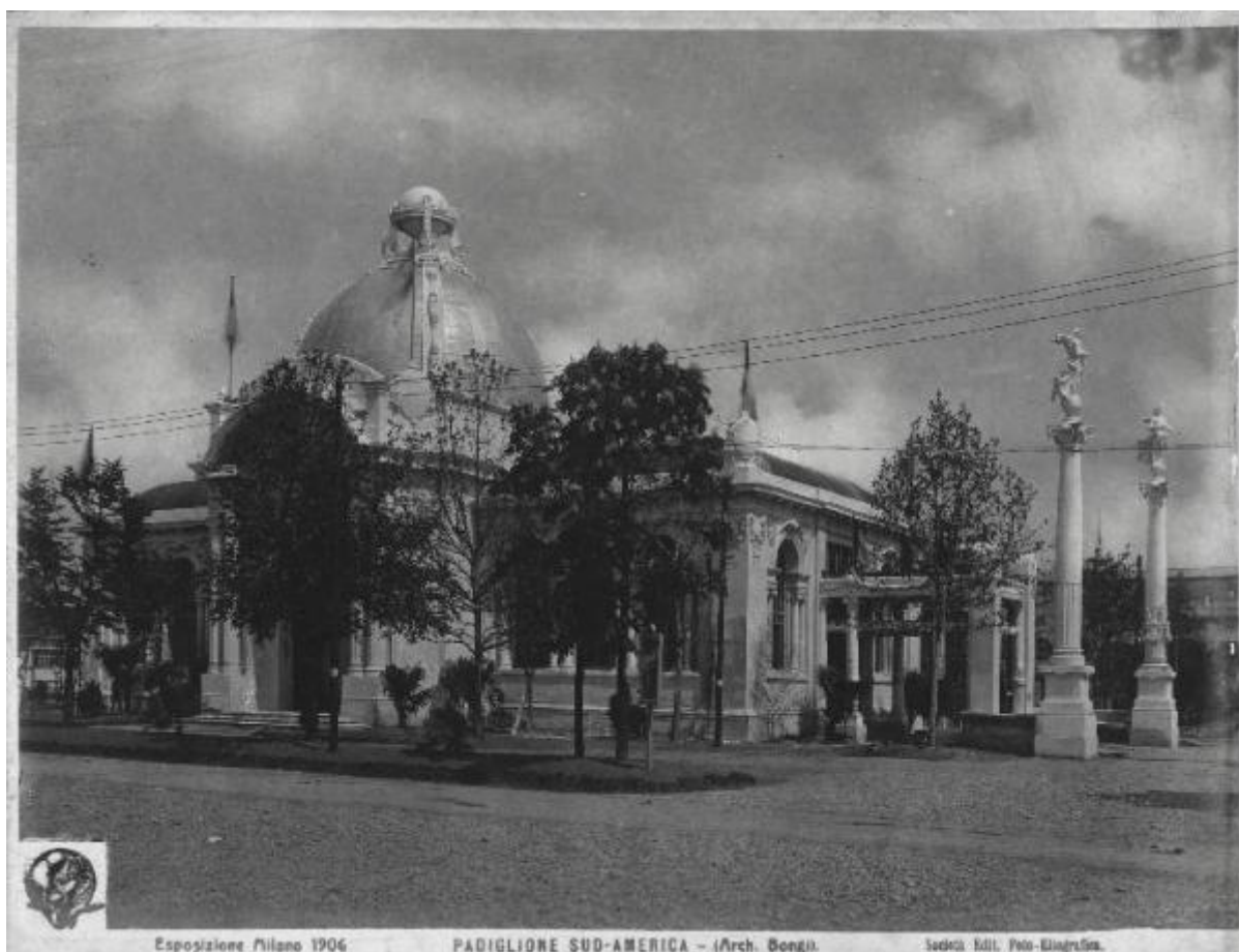
Esposizione Milano 1906